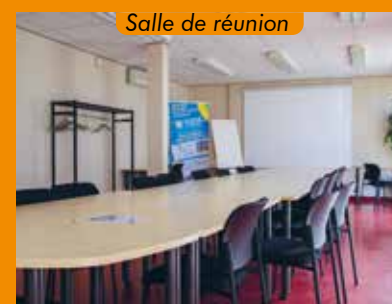
Salle de réunion