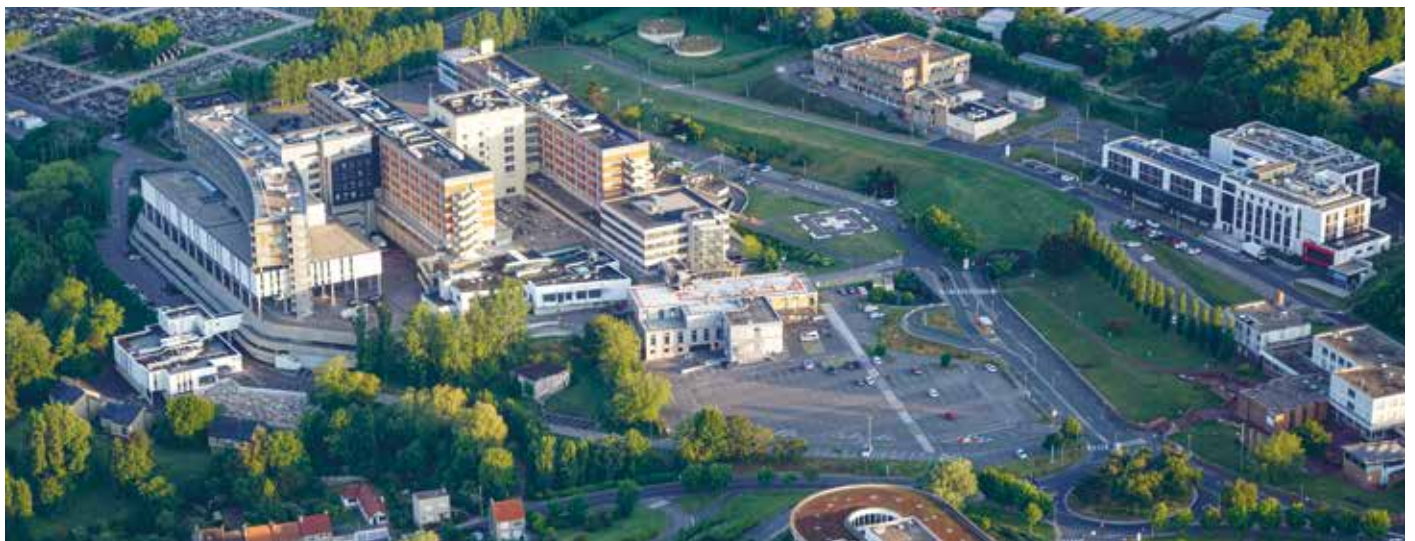
Vue aérienne du Centre Hospitalier Duchenne de Boulogne-sur-Mer

“ LA PREMIÈRE ANNÉE DE MÉDECINE À BOULOGNE-SUR-MER, INÉDITE LORS DE SA CRÉATION, EST AUJOURD'HUI UNE RÉALITÉ QUI FONCTIONNE ”