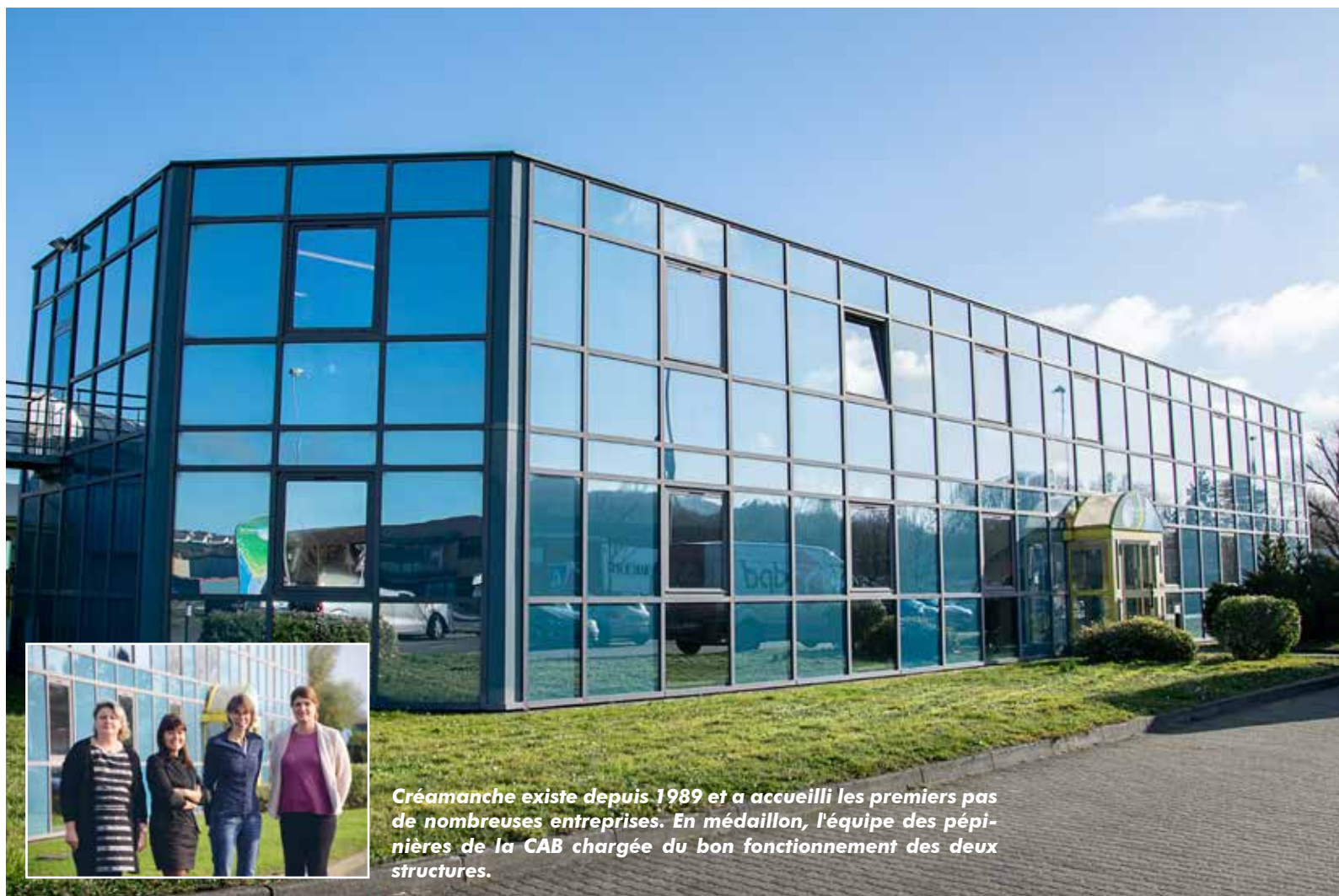
Créamanche existe depuis 1989 et a accueilli les premiers pas de nombreuses entreprises. En médaillon, l'équipe des pépinières de la CAB chargée du bon fonctionnement des deux structures.

Accompagner les créateurs d'entreprise du territoire dans leurs projets est une priorité pour la Communauté d'agglomération du Boulonnais. En mettant à leur disposition deux "pépinières" destinées à aider les "jeunes pousses" à prendre leur envol, la CAB favorise l'implantation des entreprises et donc des emplois de demain.