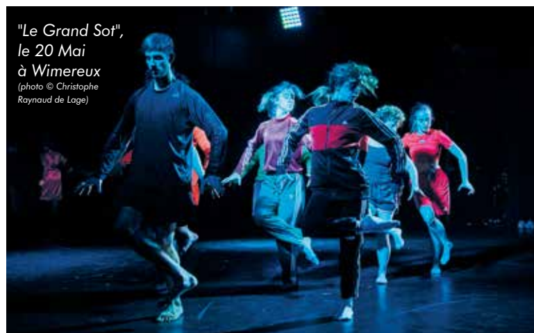
"Le Grand Sot", le 20 Mai à Wimereux

Programme complet sur : www.agglo-boulonnais.fr