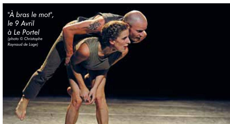
"À bras le mot", le 9 Avril à Le Portel

Deux spectacles en plein air et gratuits :