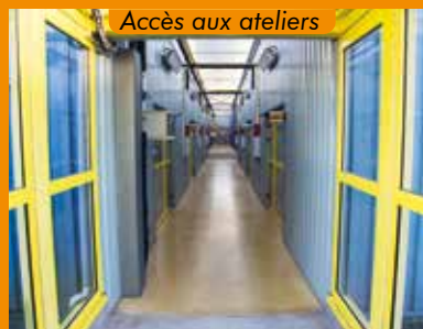
Accès aux ateliers