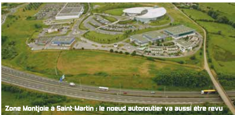
Zone Montjoie à Saint-Martin : le nœud autoroutier va aussi être revu

La décision d'aménager le tronçon à hauteur d'Escoeuilles, longtemps réclamée par les élus du Boulonnais, a été prise et annoncée officiellement par le Sous-Préfet de Boulogne et la Direction des Routes, grâce l'action de Frédéric Cuvillier, alors Ministre des Transports, sur ce dossier. D'ici 2024, cette portion dangereuse, empruntée quotidiennement par environ 9.000 automobilistes, sera rectifiée et gagnera un statut de voie express. Le chantier est titanesque, car, outre les études obligatoires (diagnostics faune-flore, trafic, agricole), il faudra arrêter le choix du tracé en associant les communes traversées et procéder aux acquisitions foncières. Il faudra ensuite réaliser la route, créer des bretelles d'accès et des embranchements. Côté A26, la SANEF va reprendre 5 km de l'actuelle portion jusqu'à Lumbres pour améliorer la connexion avec son autoroute. Côté Boulogne, le nœud autoroutier sera revu, de façon à décongestionner les giratoires de la zone Montjoie à Saint-Martin-Boulogne. Le chantier total se chiffre à 150 millions d'€. ■