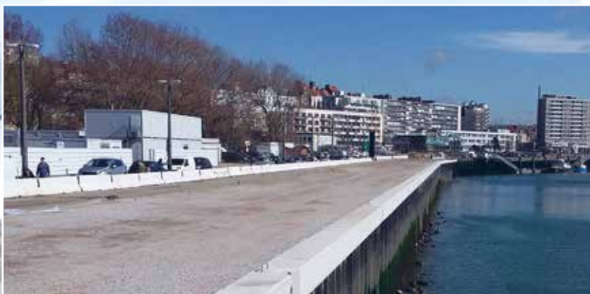
Afin que le jardin redéployé respecte au m 2 près l'ancienne surface, il a été choisi de décaler le Quai des Paquebots. Cette opération vient de se terminer