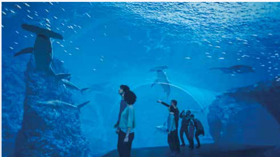
Un espace qui permettra d'admirer de nouvelles espèces dont les étonnants requins-marteaux et les gracieuses raies mantas

Le financement de la tranche ferme (57,773 millions d'euros) est d'ores et déjà assuré : 21,837 millions pour la CAB , 28,16 millions pour le Conseil Régional , 5,8 millions pour le Conseil Départemental du Pas-de-Calais , 2 millions d'euros pour l' Etat . Avec les 15 millions d'euros attendus de l' Europe , sera envisagée la seconde phase des travaux (28 millions d'euros), pour porter l'enveloppe globale à 85,8 millions d'euros.