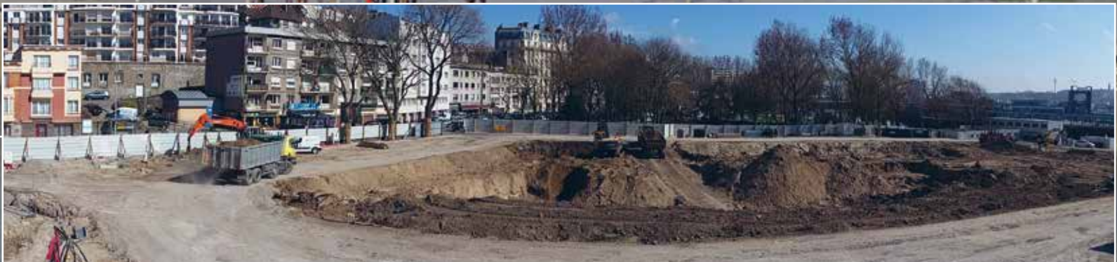
Les travaux avancent à grands pas. Très prochainement, des postes d'observation permettront au public de suivre cet avancement en direct