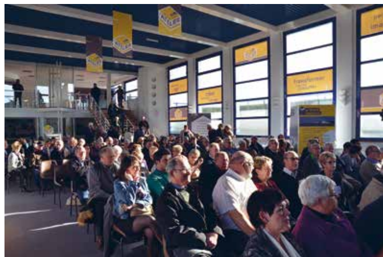
La première réunion publique a rencontré un franc succès

L'ATELIER Gare maritime BOULOGNE-SUR-MER Tél. : 03 91 18 34 87 latelier@boulogne-developpement.com