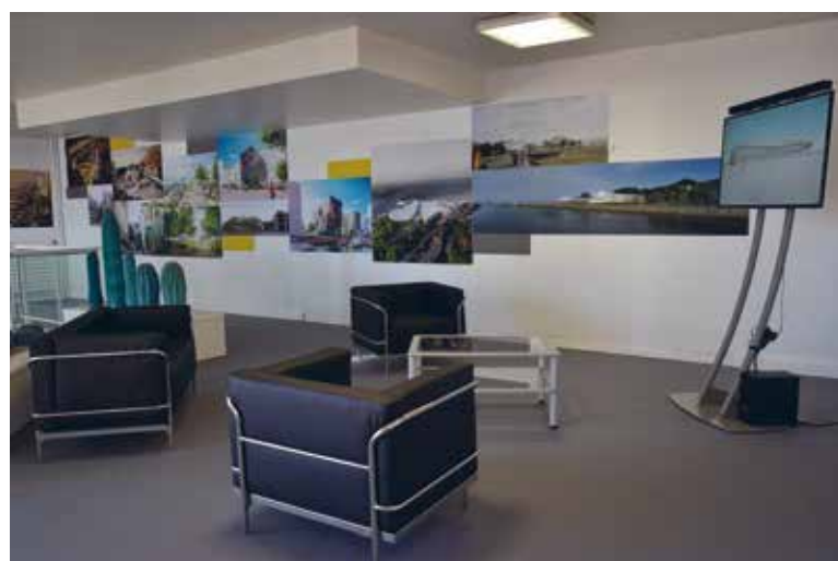
Différents "coins salons" permettent rencontres et discussions autour des projets