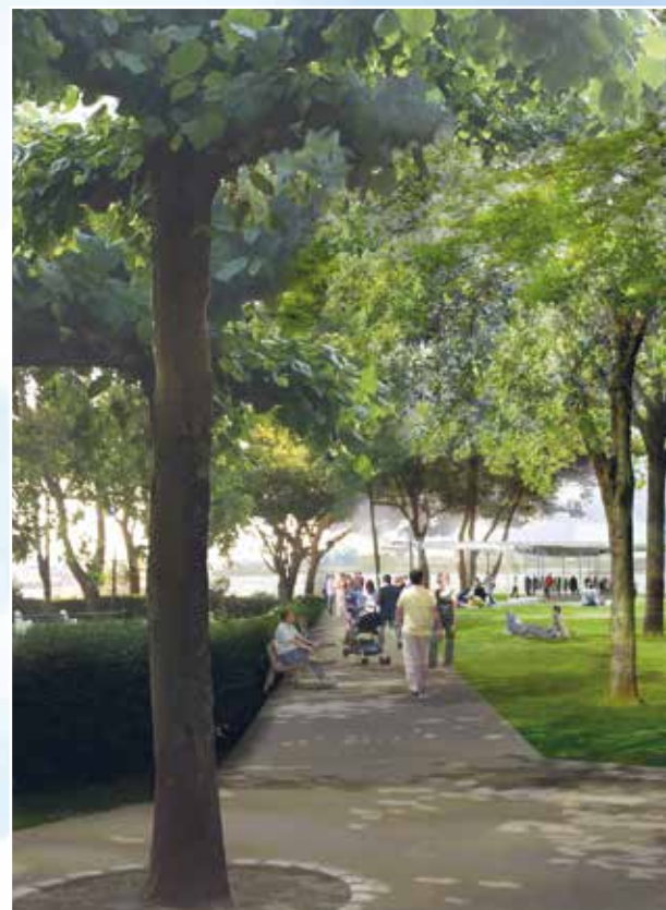
Changement important dans la topologie des lieux : l'entrée pour Nausicaá se fera "côté jardin" et non plus côté plage comme actuellement

Les travaux menés par la ville de Boulogne-sur-Mer (pour un coût de 7,3 millions d'euros) s'étaleront d'avril 2016 au printemps 2018, de la promenade Jean-Muselet jusqu'au phare rouge.