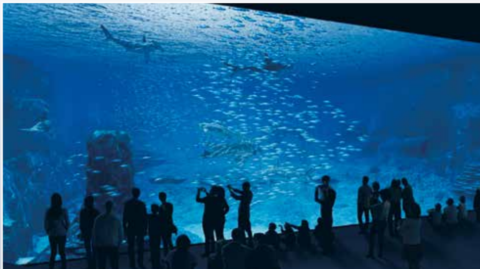
Vingt mètres sur cinq, telle est la dimension impressionnante de la baie vitrée qui permettra une vue exceptionnelle sur le plus grand bassin d'Europe (9.500 m 3 )

Pour répondre à l'ambition de l'agglomération, il ne s'agit donc pas de proposer une simple extension du Centre National de la Mer, mais bien d'un changement d'échelle.