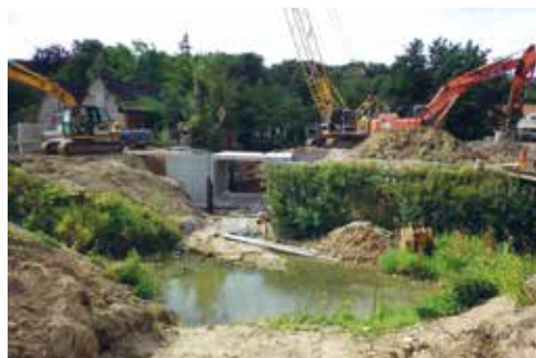
Cette passe à poissons a nécessité un chantier important

Depuis la fin des travaux, cet aménagement permet donc aux migrateurs de circuler librement sur 7 kilomètres supplémentaires de la Liane, jusqu'à Questrecques. ■