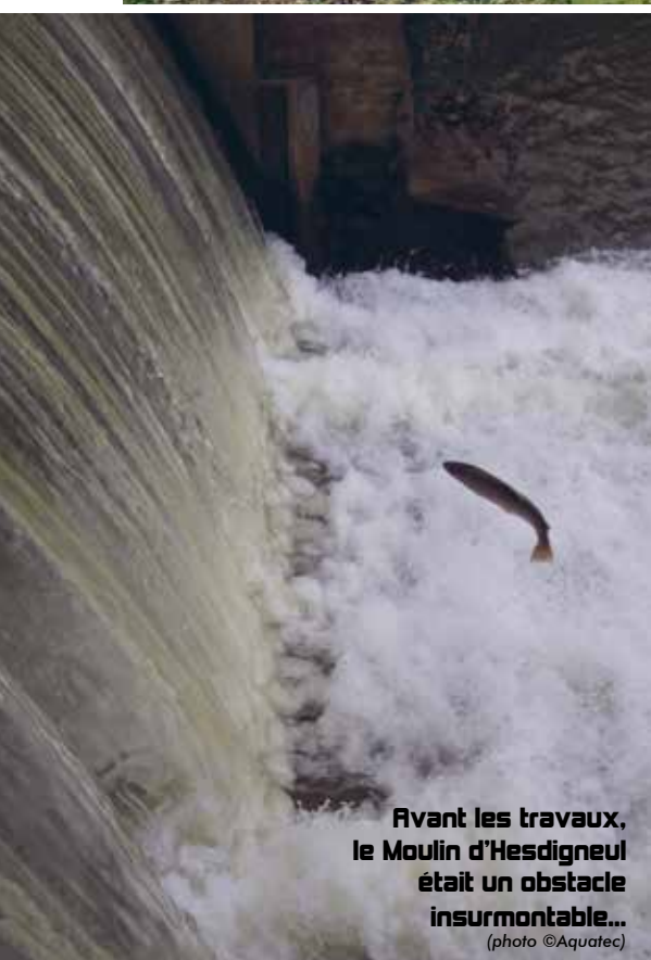
Avant les travaux, le Moulin d'Hesdigneul était un obstacle insurmontable...

L'été dernier, des engins de chantier investissaient le moulin d'Hesdigneul-lès-Boulogne. Le but : aménager une passe à poissons.