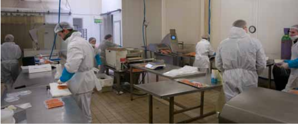
Cuisines d'Art'Rôme, traiteur de la mer