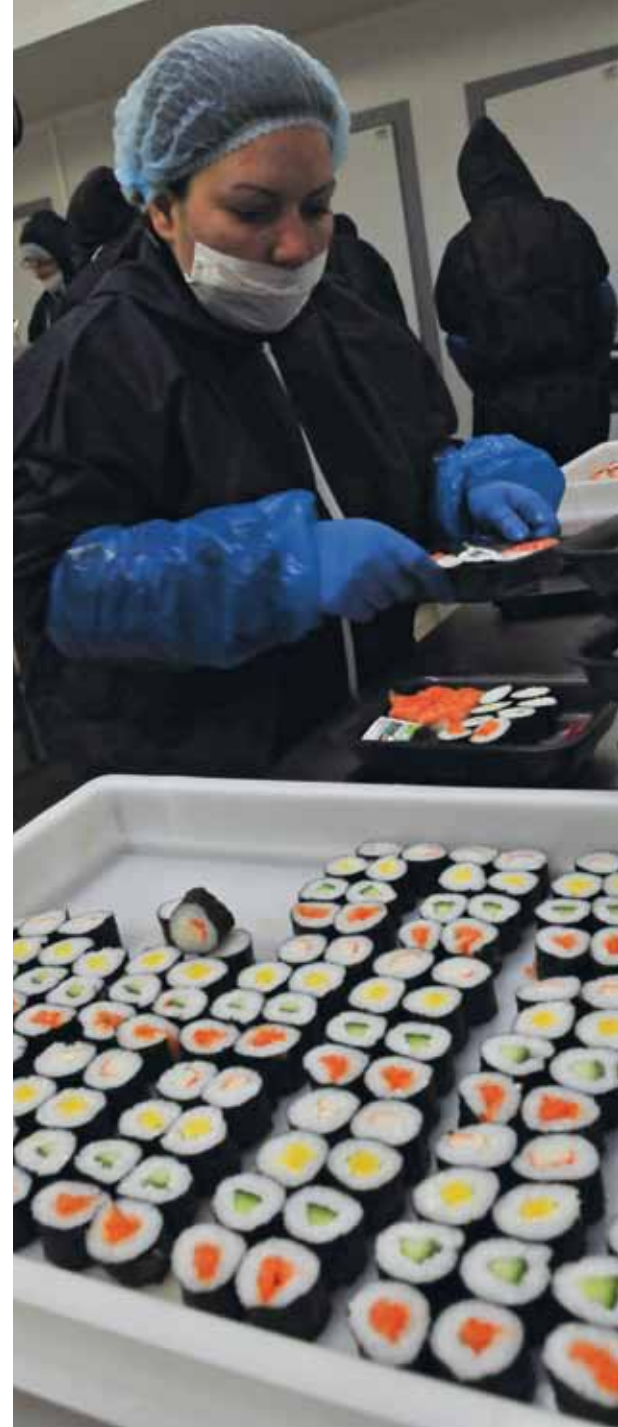
Traiteur Côté Mer : les sushis "Made in Boulogne"