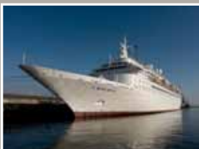
Le paquebot Black Watch en escale à Boulogne