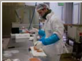
Ça bouge à Haliocap !