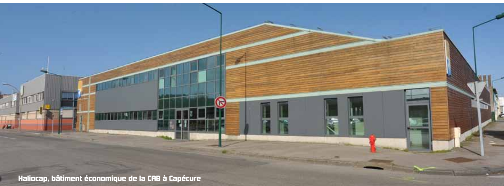
Haliocap, bâtiment économique de la CAB à Capécure