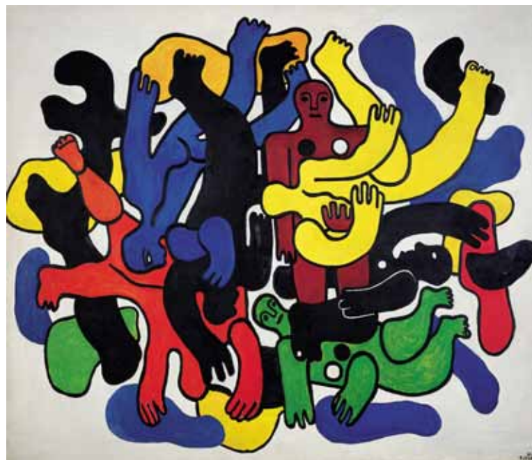
Fernand Léger "Les grands plongeurs noirs" (1944)

par le FRAC Nord-Pas de Calais, comment les artistes du début du 20 ème siècle jusqu'à aujourd'hui ont exploré les infinies possibilités de jeux de la couleur. Des accords de bleus de Picasso aux rouges vibrants de Picabia, la couleur dévoile sa puissance émotionnelle et son énergie. Elle est pour les artistes du 20 ème et 21 ème siècle un inépuisable réservoir de sensations et de recherches. Loin de l'image élitiste, le centre Pompidou Mobile propose à chacun de ressentir, d'interpréter les œuvres. Une expérience émotionnelle, en couleur, à vivre tout simplement.