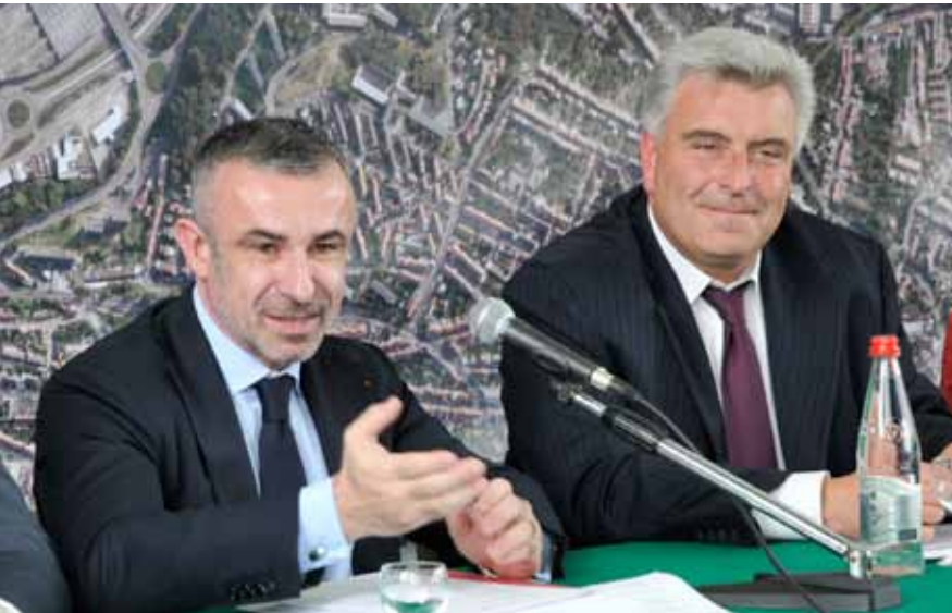
Alain SEBAN, président du Centre Pompidou, et Frédéric CUVILLIER lors de la présentation du Pompidou Mobile à la presse

Parce que l'art est pour tous, parce qu'il est une fête, le centre Pompidou s'est lancé un défi : présenter des chefs-d'œuvre majeurs de l'art moderne et contemporain dans une structure étonnante, proche de l'univers du cirque, mobile, démontable et transportable. Ce centre Pompidou Mobile effectue plusieurs étapes en France et sera à Boulogne-sur-Mer entre le 16 juin et le 16 septembre.