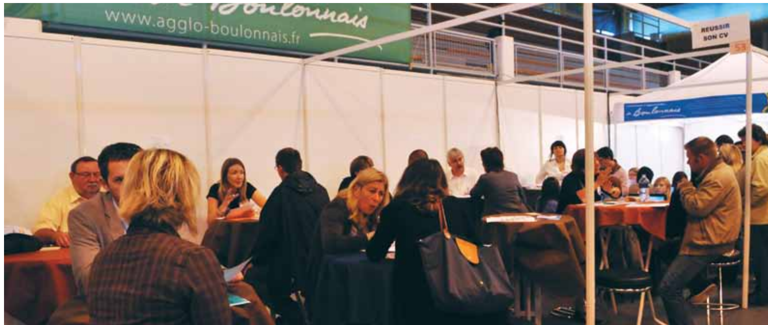
Le Forum Objectif Emplois permet à de nombreux jeunes de rencontrer des employeurs et de se renseigner sur des filières professionnelles

Plusieurs dispositifs peuvent apporter une aide pratique, financière pour aider les jeunes à décrocher un emploi.