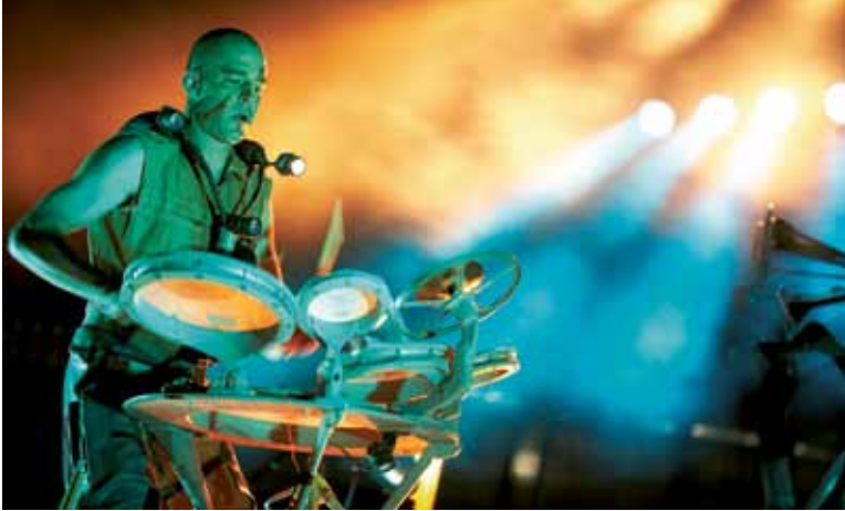
Les Commandos Percu" participeront à l'Olympic Drums, le 8 juillet Photo ©Xavier Boymond - 2007