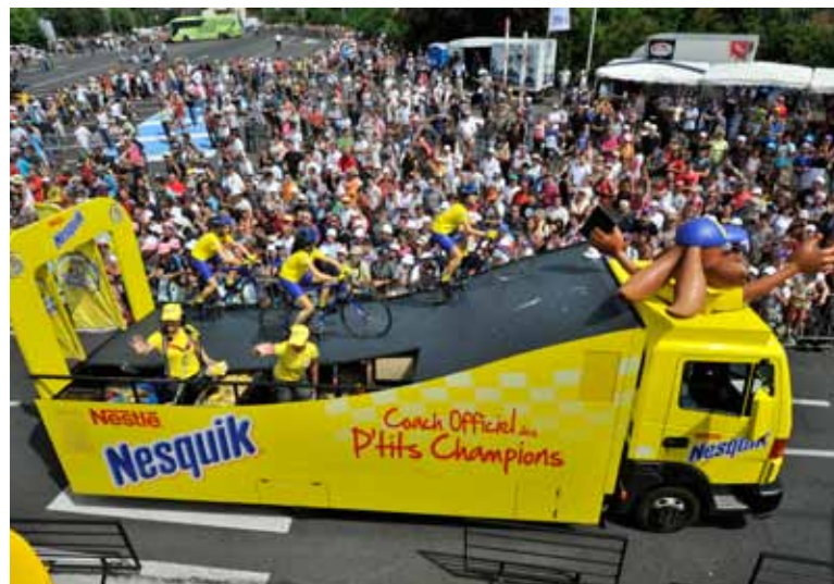
La caravane publicitaire du Tour de France est toujours très spectaculaire. Un moment très apprécié par la public.

Les connaisseurs le savent, il convient de parler des " monts du Boulonnais ". Ainsi, parmi les "détails qui font tout" évoqués par les organisateurs du