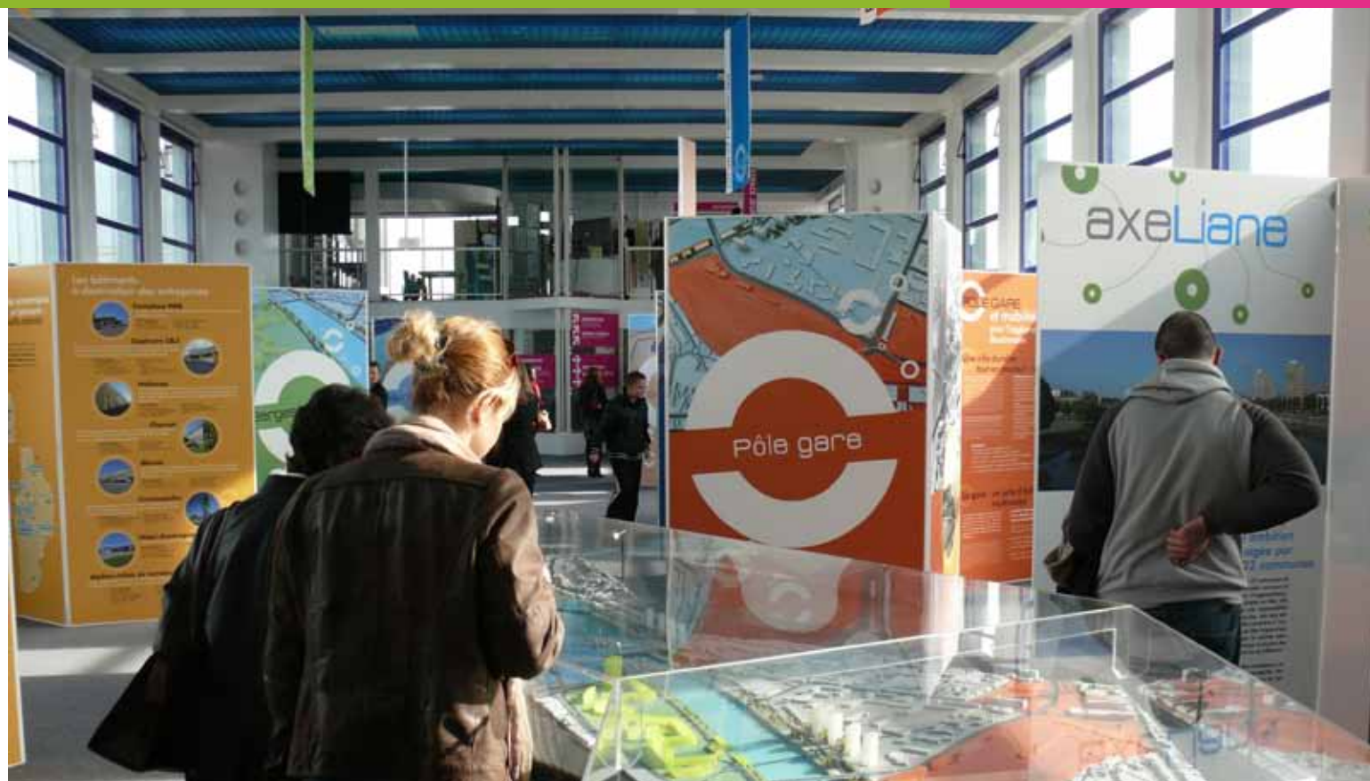
Après la Gare Maritime l'an passé (notre photo), c'est place Frédéric Sauvage et Forum Jean Noël, en extérieur, que vous pourrez visiter l'exposition Axe Liane 2