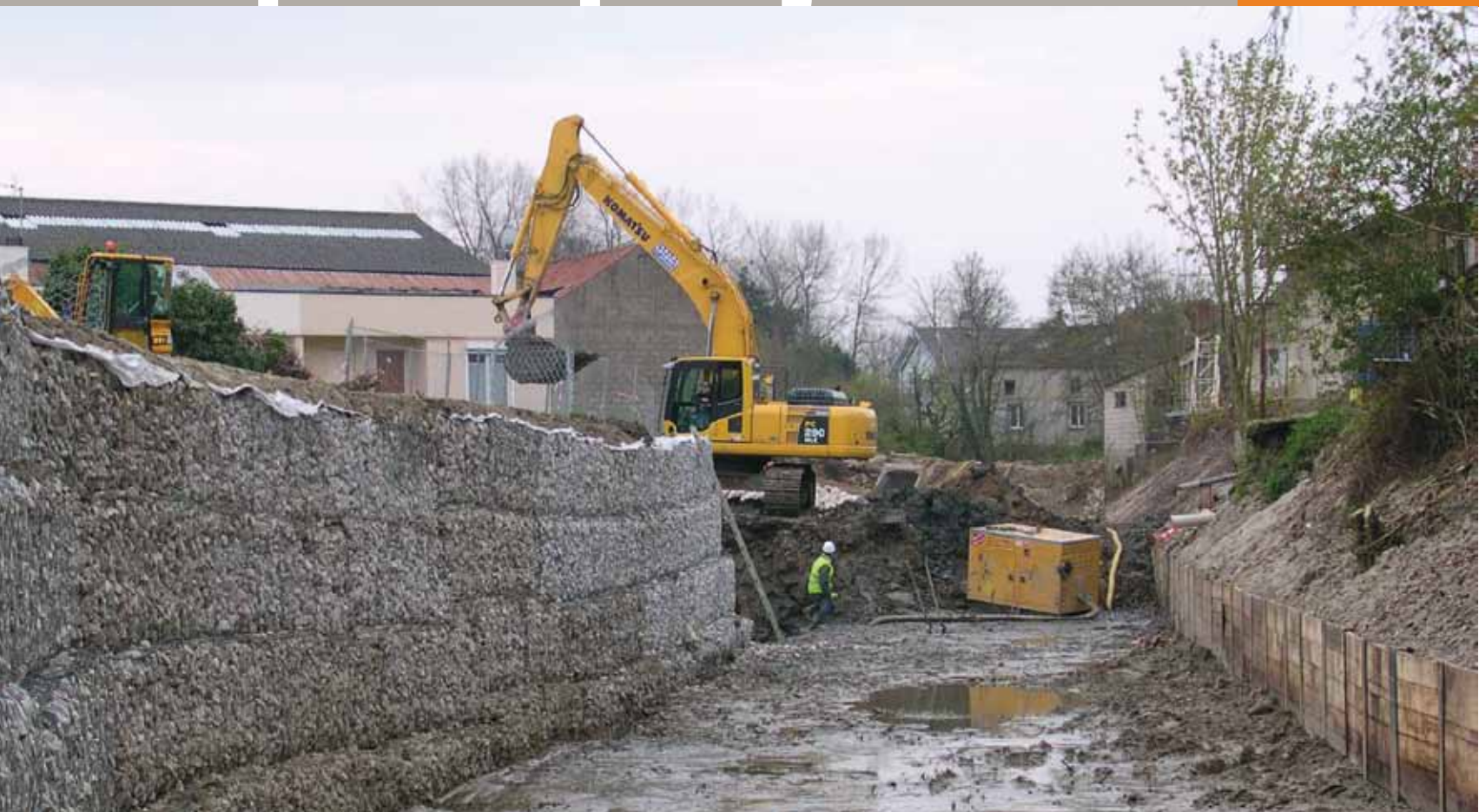
Recalibrage de la Liane au niveau de Pont-de-Briques en 2008 : élargissement du cours et abaissement du fond afin d'augmenter l'écoulement de cet endroit identifié comme un quasi bouchon