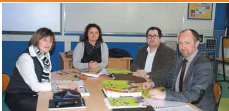
St Jo propose une nouvelle formation