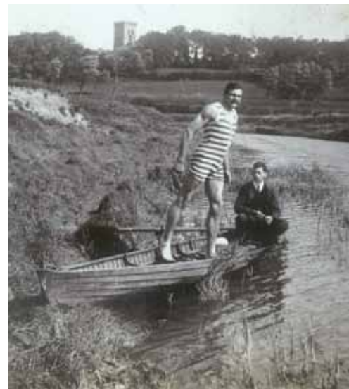
Une partie de l'exposition présentera de nombreux documents d'archive comme la photo de ce nageur en 1908

En avril 2011, une première page s'est écrite grâce à votre participation. Nous souhaitons poursuivre ce débat tout au long du processus Axe Liane. ■