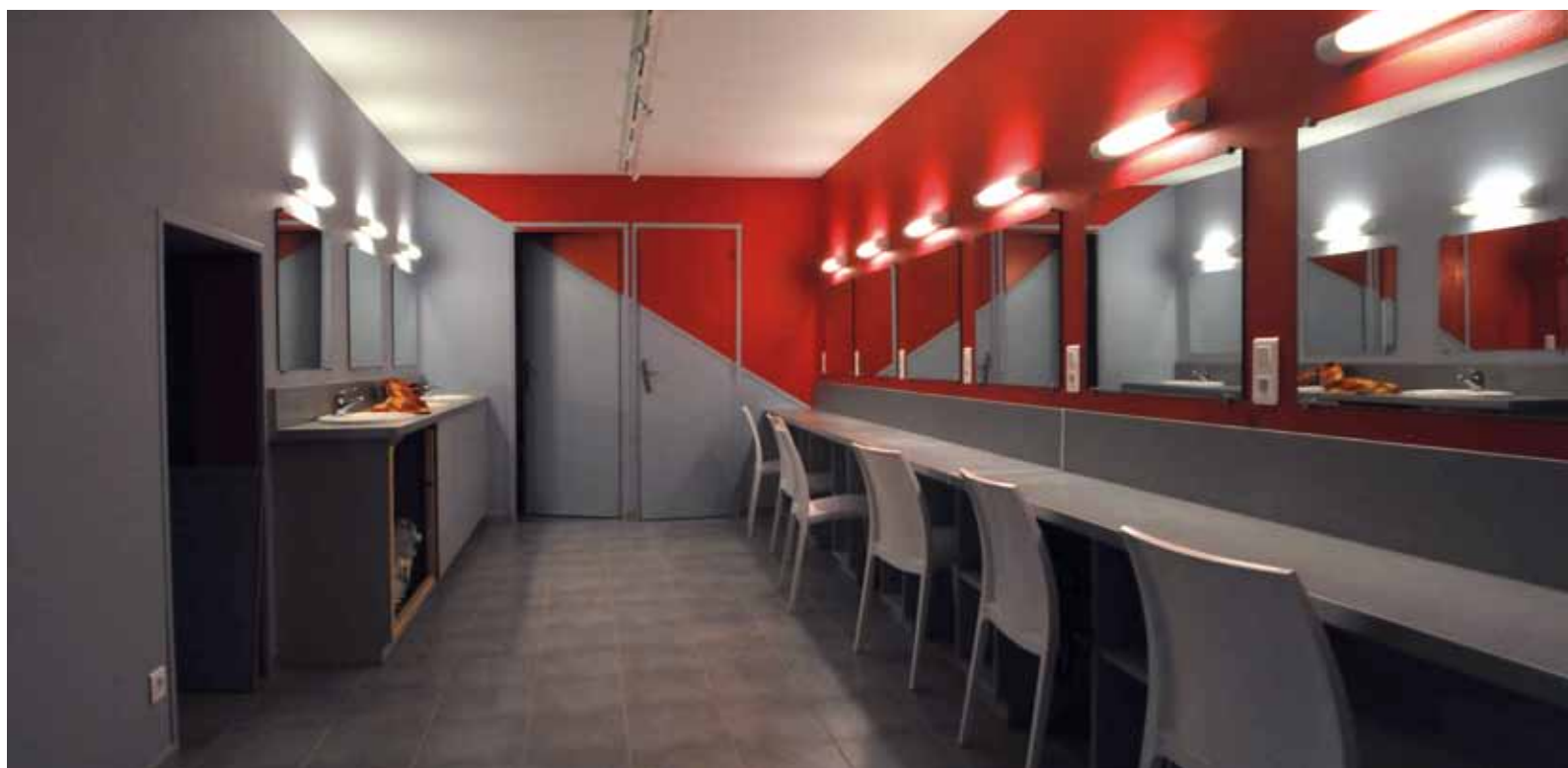
Le Rollmops dispose de loges fonctionnelles réalisées par les services de la CAB

Bien connu de nombreux Boulonnais, le Rollmops Théâtre, installé boulevard Kennedy à Boulogne-sur-Mer, opère en ce moment sa mue. Ce bâtiment, un ancien garage, est repris en propriété par l'intercommunalité au début des années 80 dans le contexte de l'installation des services du réseau TCRB derrière celui-ci. Le Rollmops Théâtre, actuel locataire, en a fait un lieu dédié à la culture.