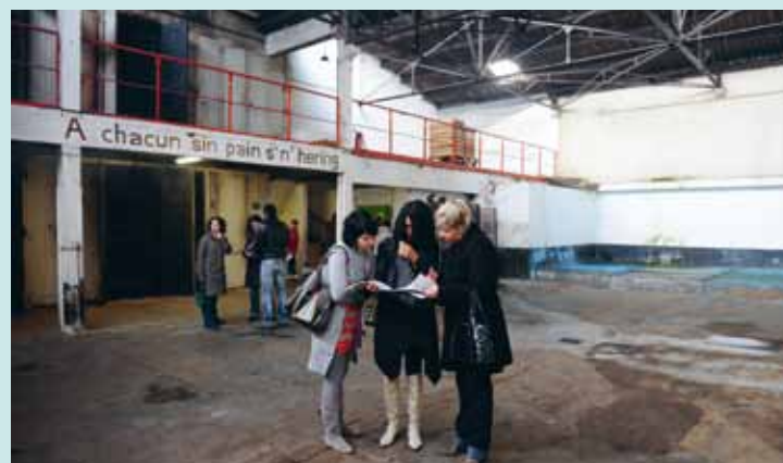
"L'affaire du chien bleu" a entraîné le public dans des lieux insolites...

Afin de valoriser et de mieux faire connaître ses atouts, le Pays Boulonnais organise depuis 2006, une manifestation : Les Paysades. Ouverture de musées, mise en lumière du savoir faire de nos artisans... ce temps fort rencontre un succès croissant. La dernière édition, le dimanche 24 octobre, a donné lieu à un fort engouement. Il s'agissait d'aider la commissaire Bouvier en participant à un vaste "rallye-cluedo", avec en trame de fond des phénomènes étranges dont un chien devenu bleu... Cette "affaire du chien bleu" ouvrait les portes de nombreux lieux et mettait en exergue la richesse de la filière bois du Boulonnais. Plus de 750 personnes se sont lancées dans cette folle aventure... Un grand succès à (re)découvrir sur www.laffaireduchienbleu.com . ■