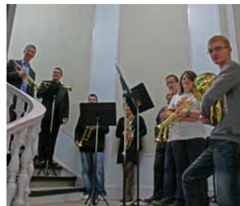
Un accueil musical était prévu pour cette inauguration

Conservatoire du Boulonnais 47, rue des Pipôts 62200 Boulogne-sur-Mer Tél. : 03 21 99 91 20 crd@agglo-boulonnais.fr