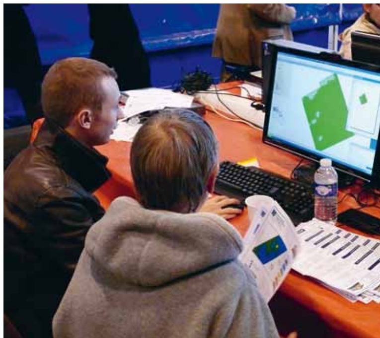
Les visiteurs du salon, dont le Président de la CAB, découvrent la thermographie de leurs bâtiments

Celui-ci a pour vocation de vous renseigner, vous accompagner