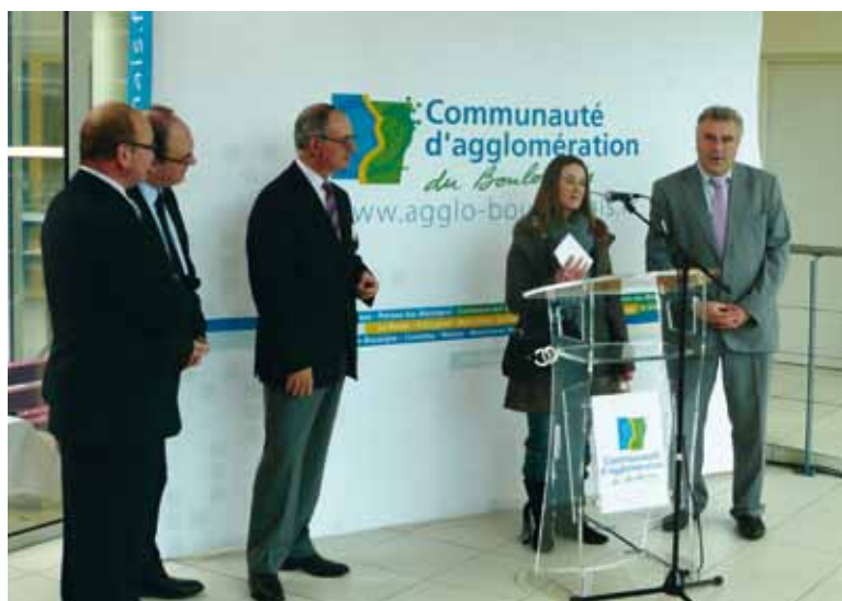
Les organisateurs du Forum Objectif Emplois remettent les lots informatiques

Le Forum Objectif Emplois, 10 ème édition, s'est tenu le 6 octobre dernier. A l'occasion de la remise de lots de la tombola organisée à cette occasion, les organisateurs ont dressé un bilan.