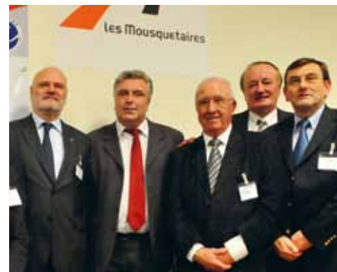
Frédéric CUVILLIER et les responsables de l'entreprise

7.500 t espérés en 2015 - de produits finis. Profitant elle aussi de la mutualisation des compétences, la base Scamer livre 600 points de vente Intermarché et Netto (Nord, Est, Ile de France) pour un catalogue de 400 références disponibles au quotidien. Pour les fêtes Noël, cela représentera pas moins de vingt semi-remorques par jour. ■