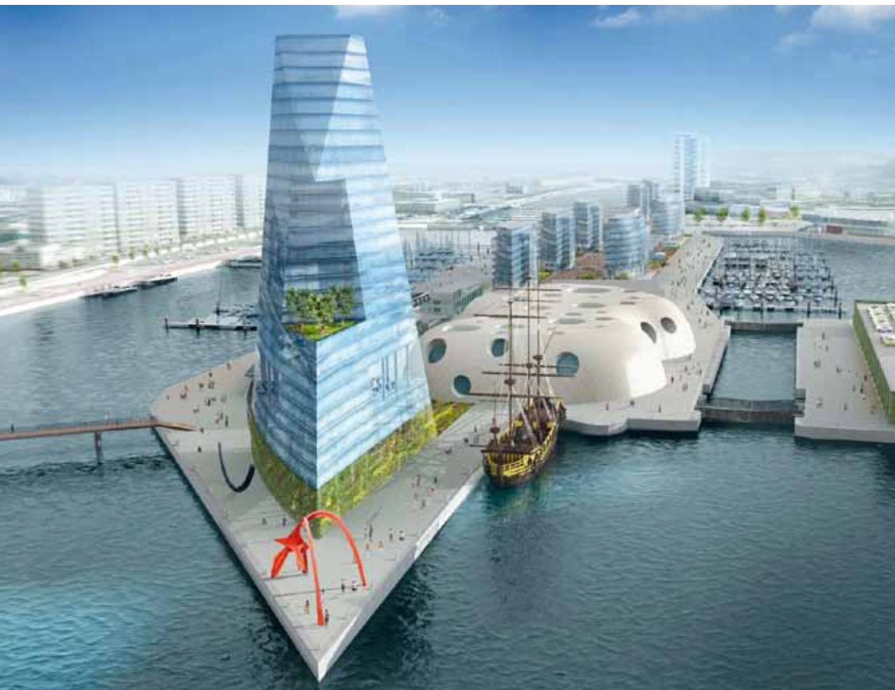
Et si demain la porte d'entrée maritime de l'agglomération, c'était ça ? (architecte Pierre-Louis Carlier)

La Région a décidé lors du dernier Conseil Portuaire de rétrocéder les terrains portuaires de République-Eperon avec la gare maritime à la Ville de Boulogne-sur-Mer