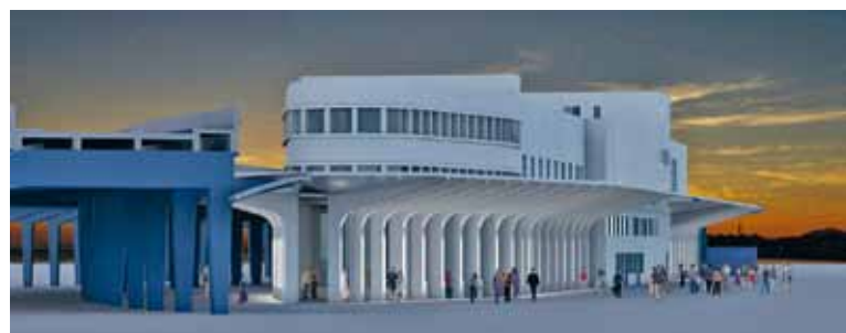
La gare maritime aujourd'hui inutilisée pourrait devenir un lieu culturel

Un débat sur le projet Axe Liane sera proposé aux habitants au printemps prochain.