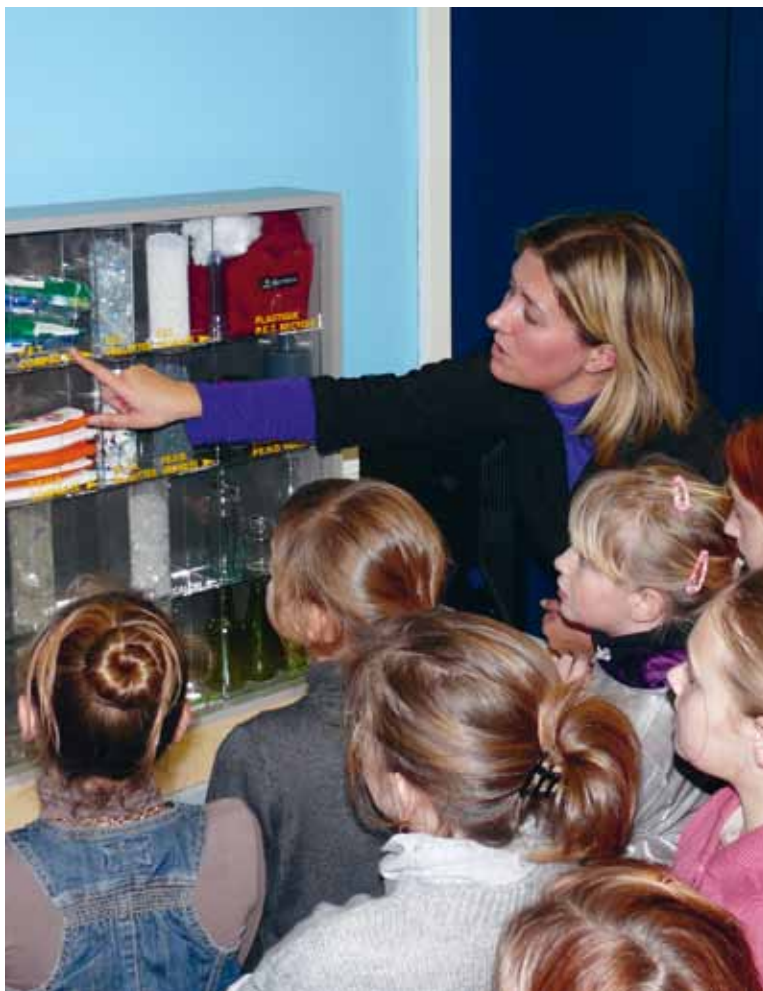
La seconde vie des déchets étonne les élèves

Mise en place entre la ville de Boulogne-sur-Mer, la CAB, l'Education Nationale, cette semaine a également permis d'équiper en bacs de tri l'ensemble des écoles de la ville qui n'en bénéficiaient pas. De même, elles sont également dotées de points de collecte pour les piles usagées. ■