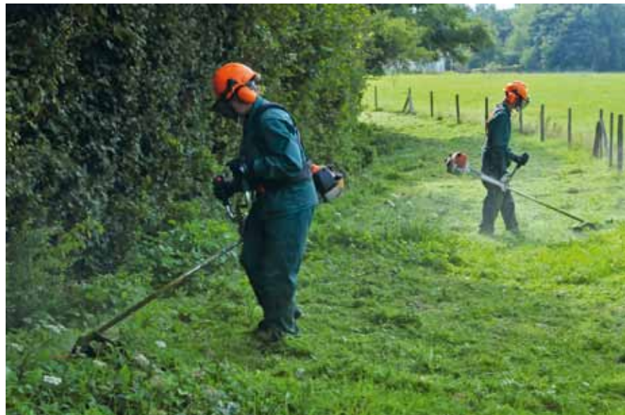
Entretien pour la CAB du chemin de randonnée "La Source aux Charmes" à Conteville

Le développement durable se résume bien souvent à des images assez bucoliques : petits oiseaux, coin de nature sauvage... Avec l'association Rivages Propres Côte d'Opale, découvrons les autres facettes du développement durable.