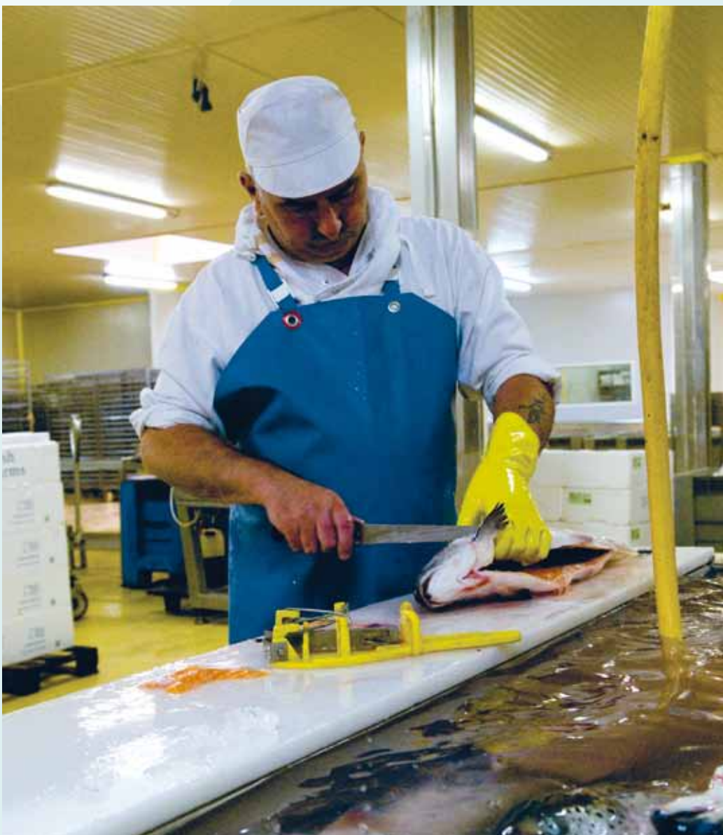
Chez Fodix (ex-Marcel-Baey)