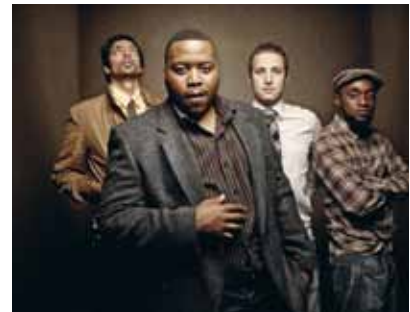
Tumi and the Volume