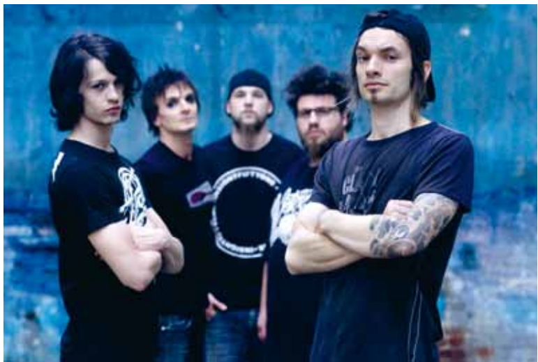
Shaka Ponk