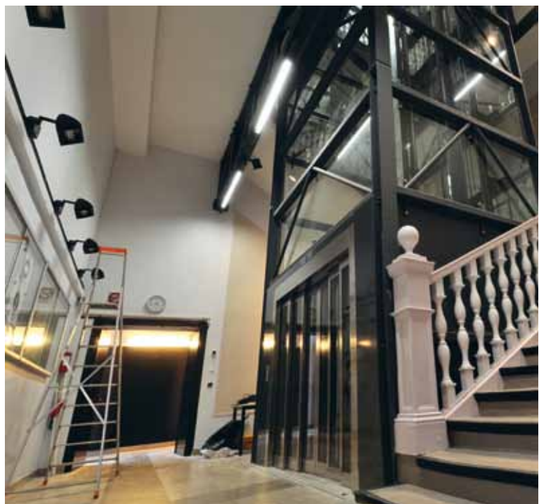
L'actualité du Conservatoire est sur : www.agglo-boulonnais.fr

Fort de ces trois sites d'enseignement de 1.200 élèves, le Conservatoire du Boulonnais démontre sa capacité à enseigner des pratiques artistiques, mais également sa volonté de se tourner vers des publics dans un cadre différent, scolaire notamment, mais également associatif. Il assure également une vie culturelle riche grâce à ses programmations tout au long de l'année. ■