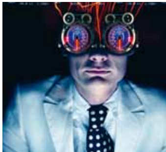
Mekanik Kantatik