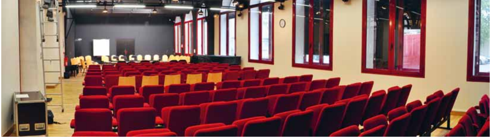
Des locaux rénovés par la CAB pour améliorer l'accueil des élèves