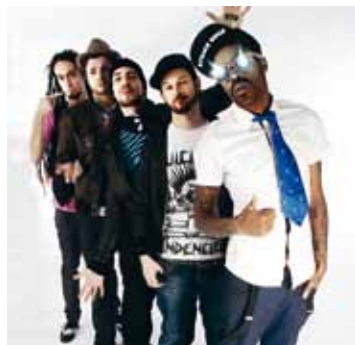
Skip the Use

Un festival 2010 à consommer sans modération ! ■