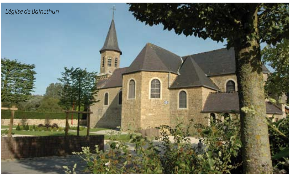
L'église de Baincthun

Renseignements : Parc Naturel des Caps et Marais d'Opale Manoir du Huisbois BP 22 le Wast 62142 Colembert Tél. : 03 21 87 90 90 www.parc-opale.fr