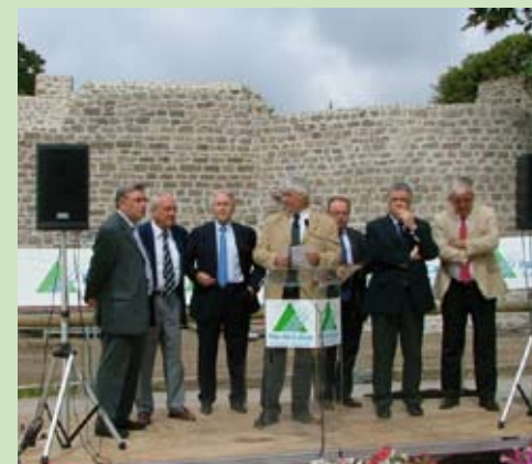
Inauguration du site en présence des élus

Le marais de Condette est rapidement devenu un lieu de balade très apprécié