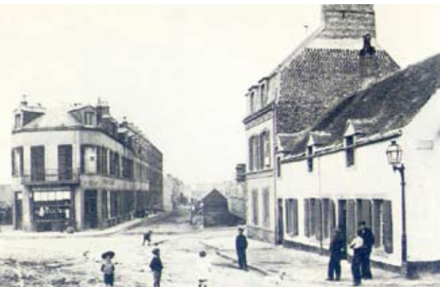
La Place du Châtillon, dans le quartier de Capécure. La plaque de rue, sur la droite, indique "Rue de Constantine". Cette place n'existe plus.