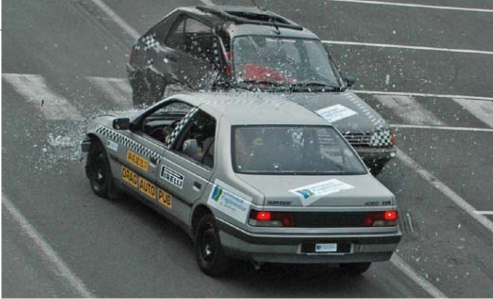
Un moment phare du village : la preuve par le choc, ici entre deux voitures... Frissons garanti !