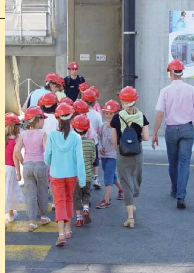
Une classe visite Séliane

Revers de la médaille, le fleuve est périodiquement sujet à de fortes crues, qui provoquent des inondations toujours mal vécues par les riverains. La CAB, en créant et en finançant le SYMSAGEB (Syndicat Mixte pour le Schéma d'aménagement et de Gestion des Eaux du Boulonnais, présidé par Jean-Loup Lesaffre), montre sa détermination à régler ce difficile "problème de robinet" en coordination avec les autres intercommunalités du Boulonnais. A la suite de plusieurs études qu'elle a financées, déjà d'importants travaux ont permis d'optimiser les conditions d'écoulement de la Liane. En aval, la reconstruction de l'écluse Marguet a amélioré l'évacuation des crues.