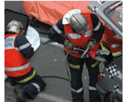
Les pompiers en simulation d'intervention