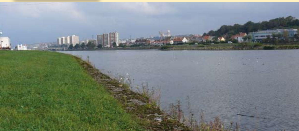
Fin de parcours pour la Liane, à l'entrée de Boulogne-sur-Mer

Le SYMSAGEB poursuit ce curage de part et d'autre du pont après avoir mis en place les confortements de berges adaptés. Ces opérations permettront d'augmenter la section de l'ouvrage, et donc de faire passer sans débordement d'éventuelles crues plus importantes.