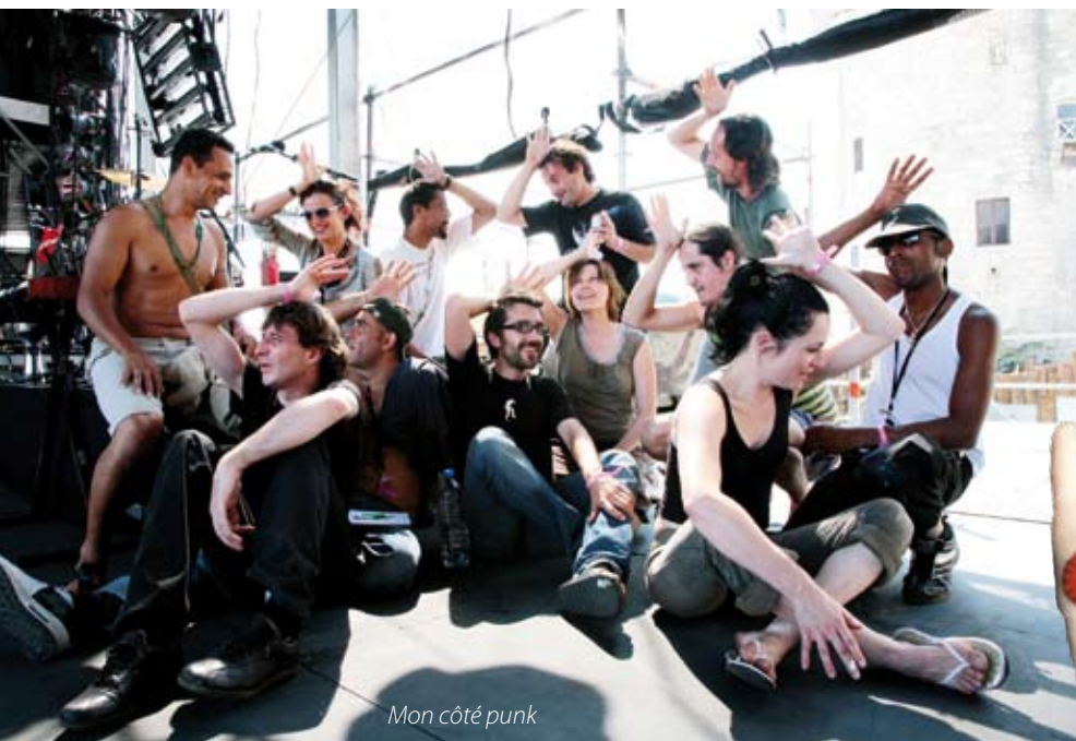
Mon côté punk