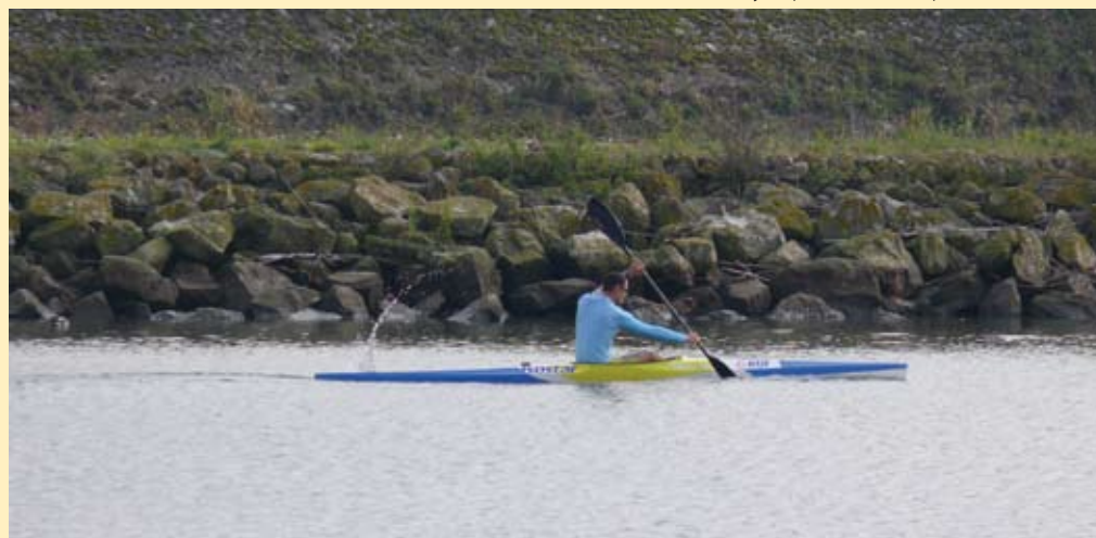
Entraînement kayak pour les champions