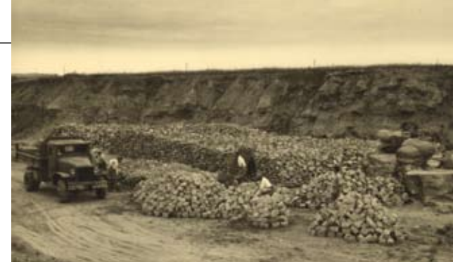
Extraction de la pierre de Baincthun dans les années 50 (doc. famille Rigail)

L'exploitation de la pierre de Baincthun a cessé depuis peu, ne répondant plus aux impératifs modernes de rentabilité. Une