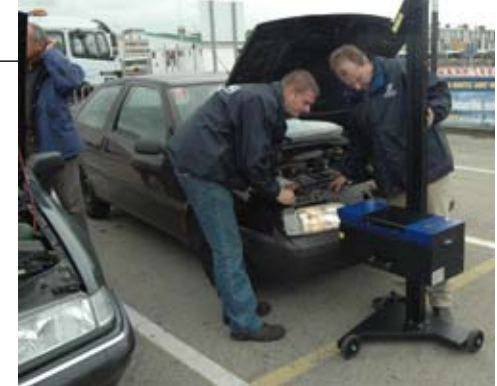
Sur le village vous pourrez faire contrôler certains points de votre véhicule