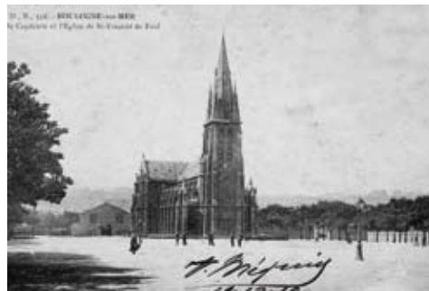
Ci-dessus l'église St-Vincent-de-Paul détruite pendant la dernière guerre

de l'ancienne usine Comilog. Des entreprises vont s'y installer pour leur développement... Capécure affirme désormais son statut de premier pôle européen de transformation des produits aquatiques et de pôle de compétitivité nationale. ■