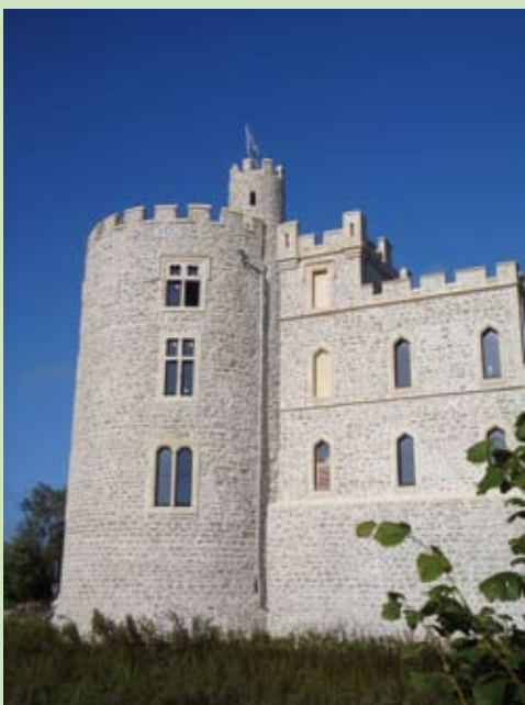
La restauration du château se veut exemplaire en matière de développement durable

delot et d'Ecault, au cœur d'un patrimoine naturel remarquable, que nous devons absolument protéger. Nous avons le projet de créer une liaison verte entre la R.D. 940 et le Centre Bourg et de relier les espaces naturels, entre-eux, sur tout le territoire communal. C'est pour toutes ces raisons et notamment afin de gérer les eaux de pluie, de source et de ruissellement que nous souhaitons devenir propriétaire des "Bas-Champs". En ce qui concerne le marais, nous avons entrepris les démarches pour le classer en "Réserve Naturelle Régionale". Nous souhaitons, ainsi, en pérenniser la protection et favoriser une prise de conscience encore plus importante chez les usagers qui pénètrent sur le site. Le Projet est tentaculaire. Il devrait permettre, à terme, de relier les zones humides au marais par chemins, cours d'eau et fossés.