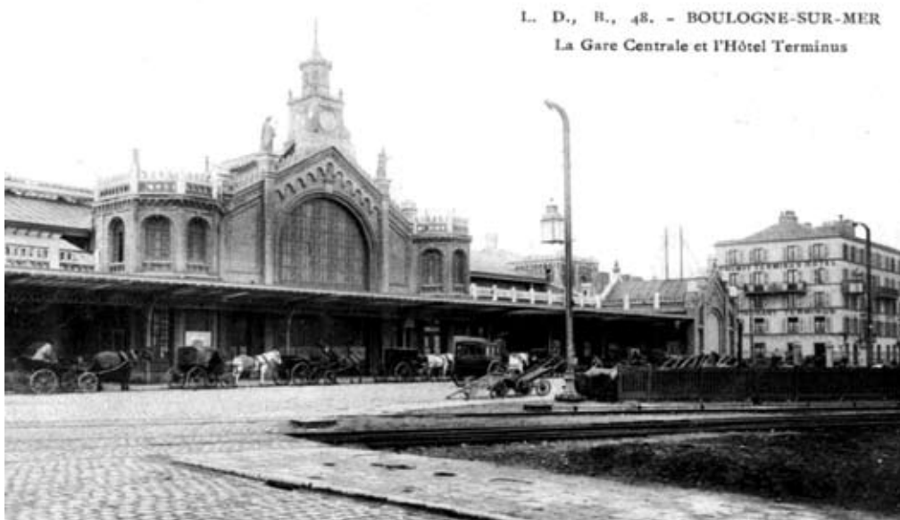
La gare centrale et l'hôtel Terminus étaient situés à Capécure

tations : le quartier "Damrémont". Entre les deux, le viaduc Jean-Jaurès a pris place, monument à la modernité, à l'automobile, il se dresse là où se tenait auparavant l'église St Vincent de Paul sur la place de Capécure !