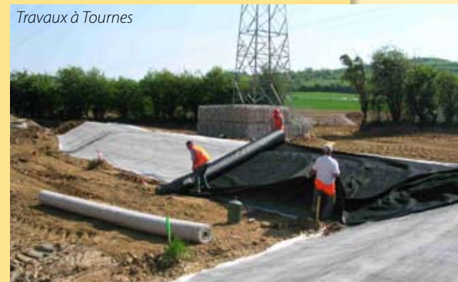
Travaux à Tournes