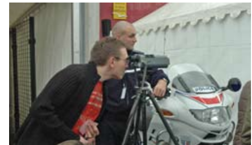
Et si, pour une fois, c'était vous qui étiez derrière les "jumelles-radar" ?

d'urgence d'un autocar et un simulateur moto.