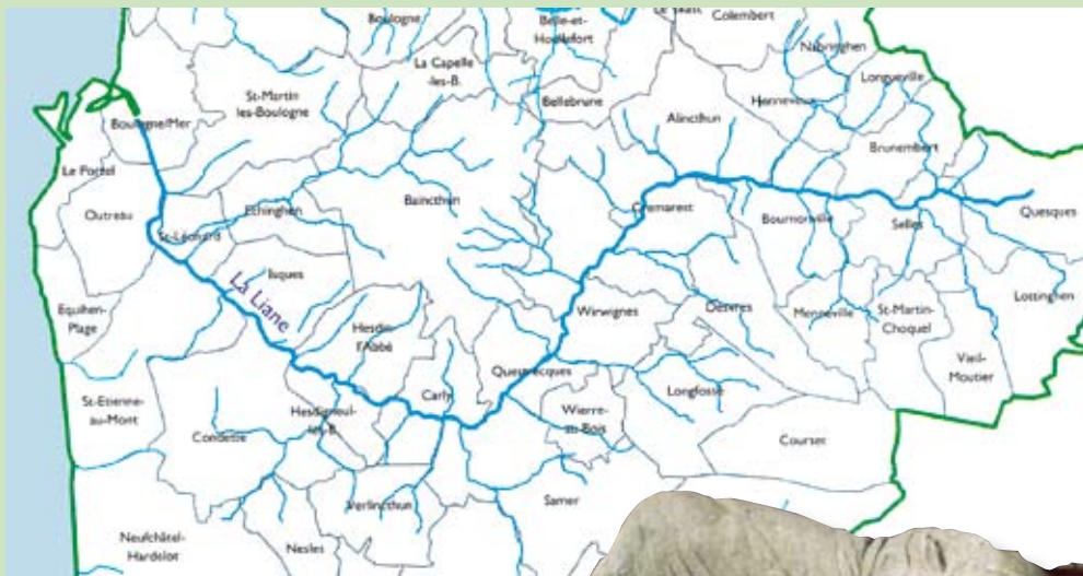
De Quesques à Boulogne-sur-Mer, le parcours de la Liane