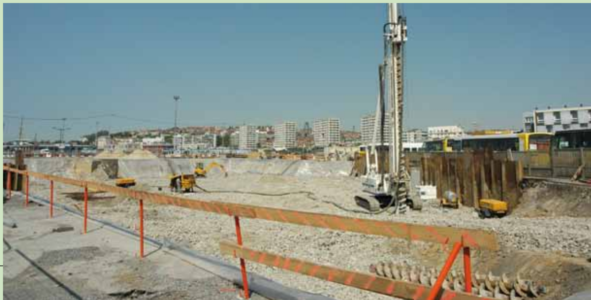
Place de la République, début des travaux pour le futur casino