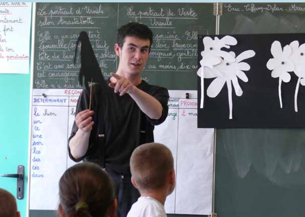
Intervention en classe sur le théâtre d'ombres

mettre en œuvre un nouveau volet culturel : celui de la sensibilisation, de l'éducation artistique des plus jeunes. Le postulat étant qu'avant d'entrer dans un cycle d'enseignement artistique (musique, danse, beaux arts,...) ou de fréquenter régulièrement des manifestations culturelles, il convient de démontrer que l'art est pour tous, de le démystifier, d'ouvrir les esprits, d'attiser la curiosité, de favoriser les pratiques, le plus tôt possible et dans un cadre familier, celui de l'école en l'occurrence.