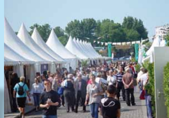
Le "Village des pêcheurs" a reçu de très nombreux visiteurs