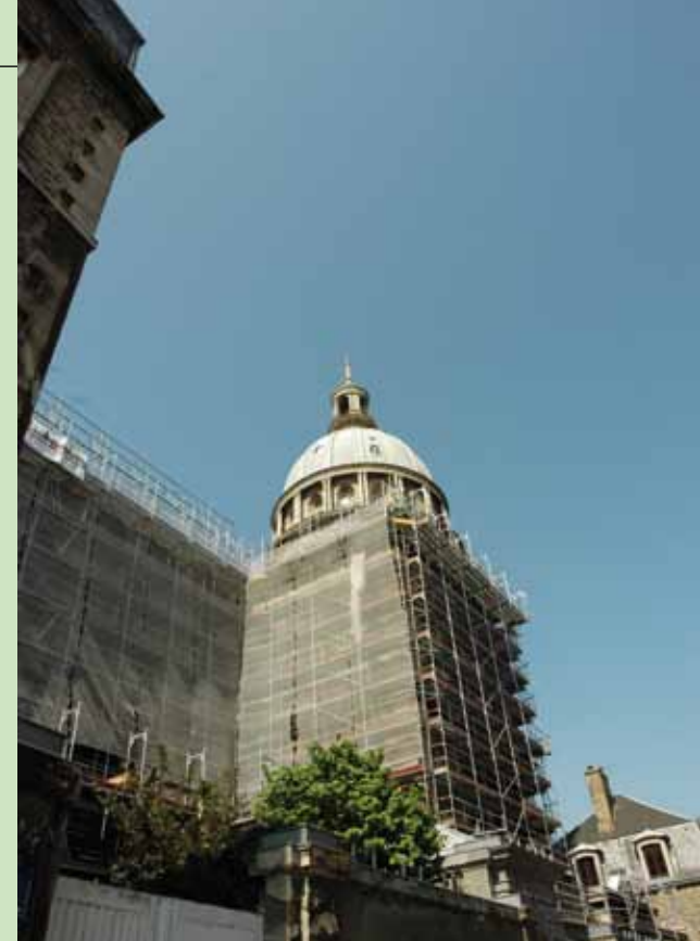
La cathédrale en pleine réfection

La ville-centre se transforme au plus grand bénéfice de toute l'agglomération. ■