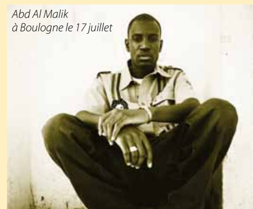
Abd Al Malik à Boulogne le 17 juillet