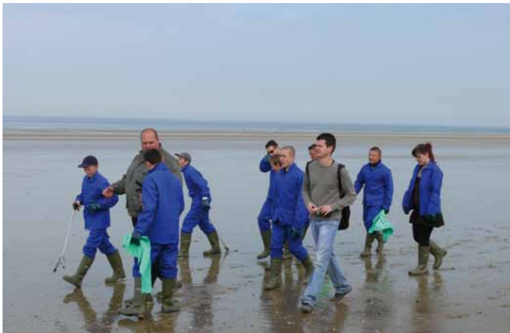
La jeune équipe en route pour une matinée de nettoyage d'une plage

C ongés, temps agréable ne riment pas toujours avec repos, inactivité, pour les jeunes du Boulonnais. Ils sont une quinzaine, bénévoles, à s'être impliqués dans des chantiers "jeunesse" lors des dernières vacances de Pâques.