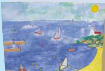
Estelle Louis (10 ans)