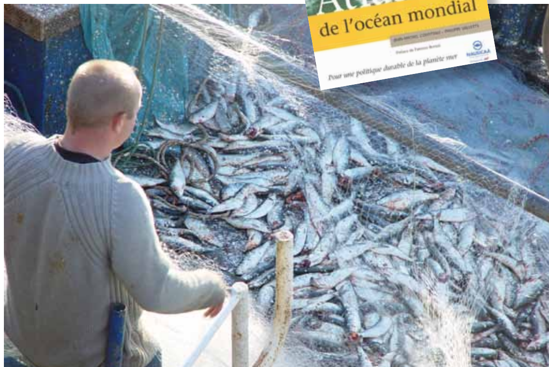
L'Atlas insiste sur l'urgence de la gestion des ressources