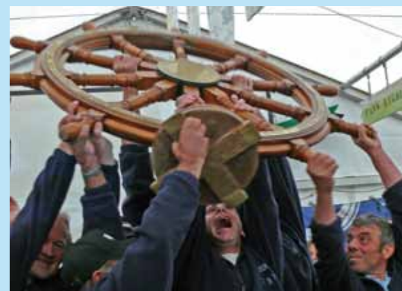
Vainqueurs au général, l'équipage de Royan verra son nom gravé sur le prestigieux trophée