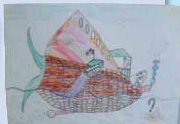
Raphaëlle Tison (9 ans) "Mention spéciale" du jury pour son inventivité