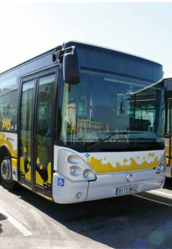
Le nouveau modèle de bus GNV

O rganisatrice des transports urbains, dont elle délègue, sous contrôle, l'exécution quotidienne à TCRB, la CAB a souhaité une modification partielle du réseau afin de l'adapter aux évolutions récentes.