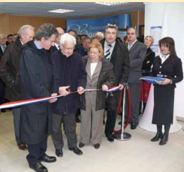
Le 23 mars était inauguré Haliocap. Le lendemain, de nombreux visiteurs découvraient ce nouvel équipement économique.

L'agglomération dispose également d'une pépinière spécialisée dans le domaine des Technologies de l'information et de la communication : E-Placenet ( www.e-placenet.com ).