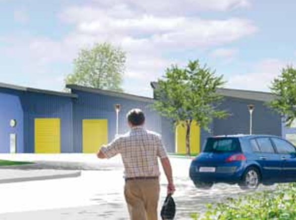
Esquisse du futur hôtel d'entreprises, parc de la Liane (à proximité de Créamanche)

En quelques années, l'agglomération boulonnaise a démontré sa volonté économique en se dotant d'outils modernes et utiles pour l'implantation, la création d'entreprises et donc d'emplois. La filière des produits aquatiques, reconnue Pôle de Compétitivité, qui fait la renommée mondiale du Boulonnais, bénéficie de nombreuses attentions. Cela n'occulte pas les engagements en cours pour diversifier notre économie et favoriser le développement des PME et PMI. ■