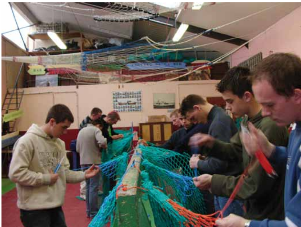
Les élèves du lycée étudient tous les aspects du métier de marin