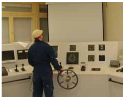
Grâce au simulateur, les élèves peuvent se familiariser avec leur futur environnement professionnel

Bien des anciens marins reviennent à l'école pour y faire partager leur expérience et transmettre leur savoir à la jeune génération. De fait, le lycée a la particularité de nouer de formidables liens affectifs entre les élèves, l'équipe pédagogique et la grande famille des navigants. L'organisation de la vingtième édition du Défi des ports de pêche en est une vivante illustration. ■