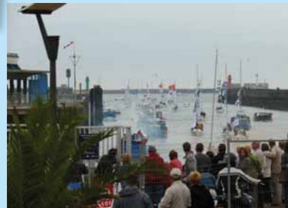
Arrivée triomphales de voiliers accompagnés des chalutiers pour le plus grand plaisir des spectateurs.