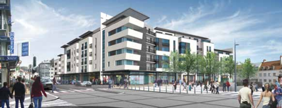
Vue du projet architectural de la place Lumière

700 logements, la construction de 765 logements dont 644 sur le site, et la réfection de 226 autres logements. La Ville de Boulogne ayant pris de l'avance lorsqu'elle a démarré son Grand Projet de Ville, le plan de rénovation urbaine pourrait être étendu aux quartiers Damrémont et Triennal.