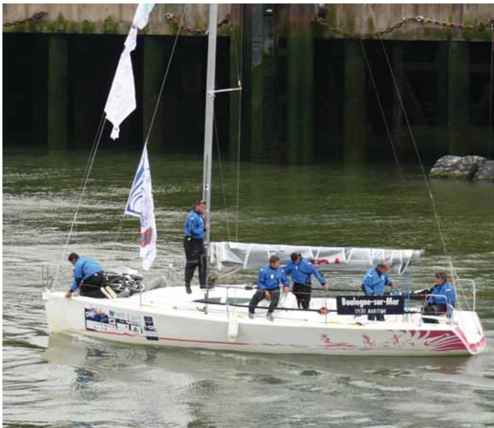
8 ème place au général du Défi des Ports de Pêche pour le lycée qui en outre organisait l'épreuve (voir p. 7)