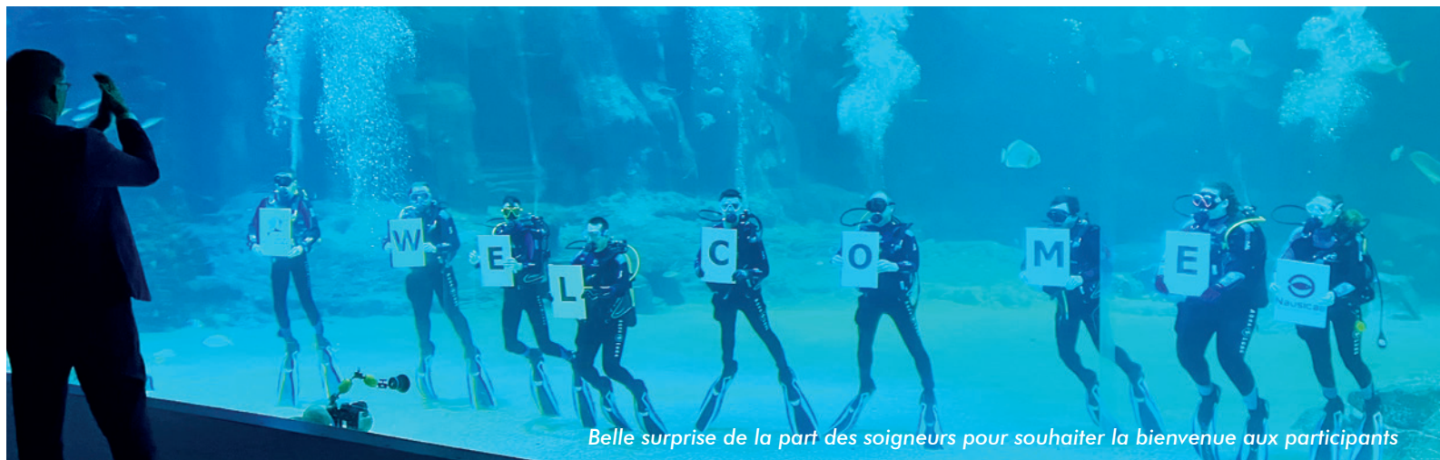
Belle surprise de la part des soigneurs pour souhaiter la bienvenue aux participants