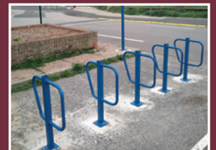
Une agglo riche en aménagement cyclable