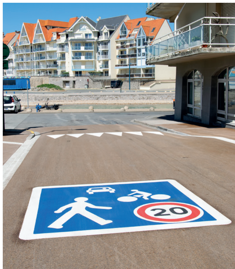
Rue Léon Fayolle, à Wimereux

Afin de compléter ce schéma cyclable et de faire de ce territoire, un territoire axé sur les mobilités durables, environ 692 stationnements pour vélo ont été aménagés depuis 2020.