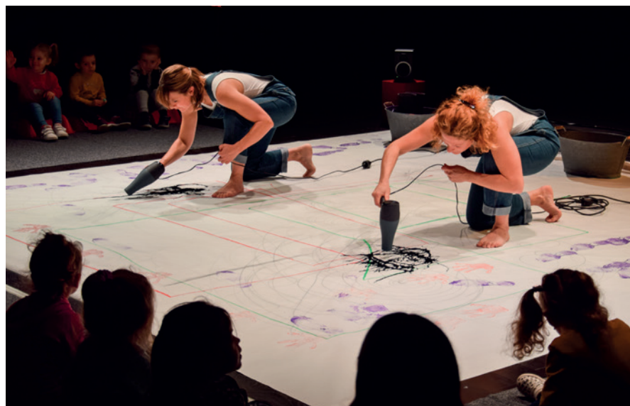
Spectacle GRAPH, par la Cie Sac de Noeuds

Retrouvez toutes les informations sur les intervenants sur le site internet de la CAB : www.agglo-boulonnais.fr