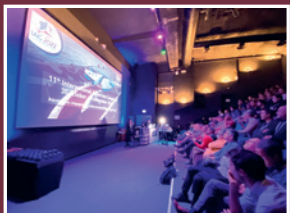
Le congrès international des aquariums