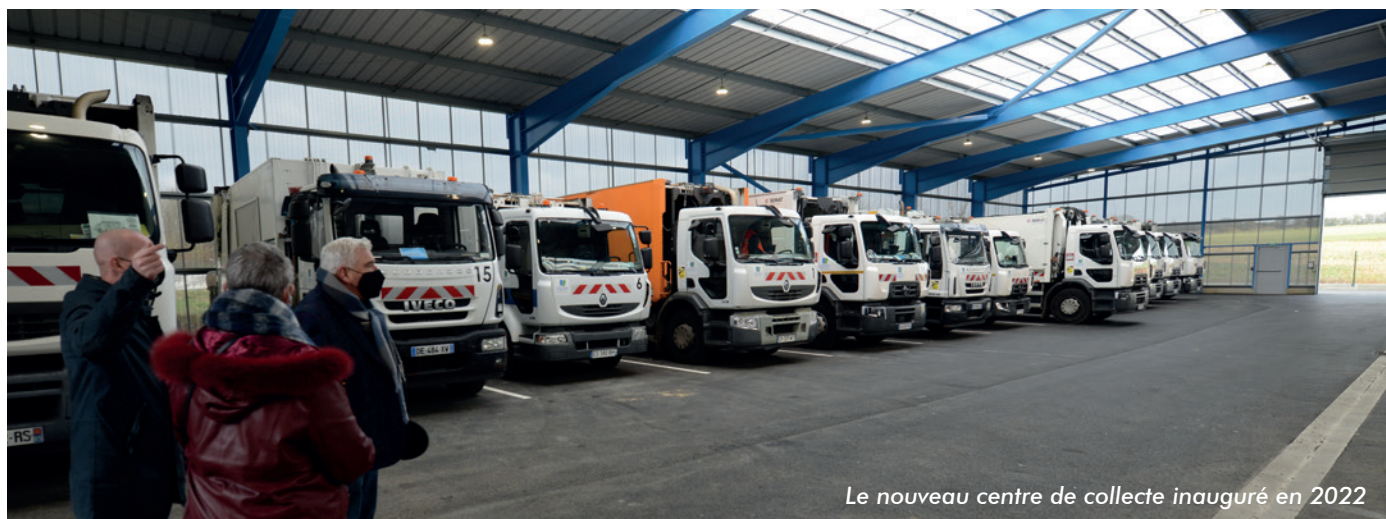
Le nouveau centre de collecte inauguré en 2022

Au nom du conseil communautaire, je vous souhaite d'excellentes fêtes de fin d'année.