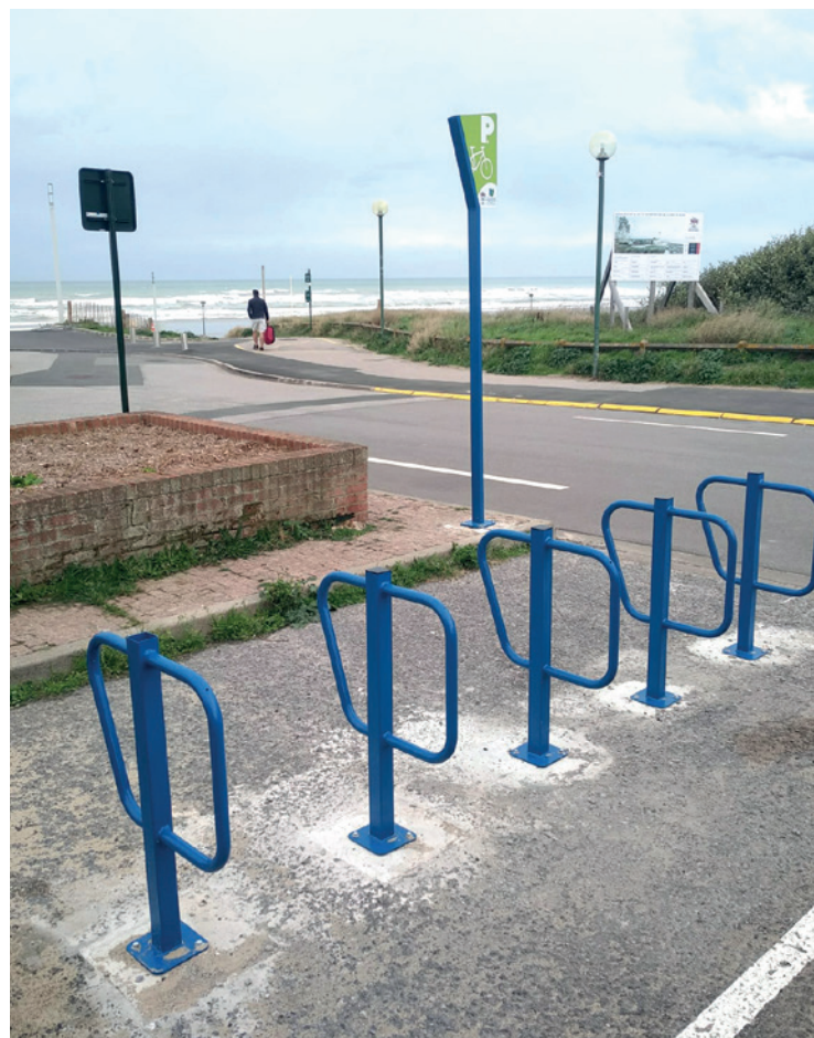
Avenue du Général de Gaulle, à Neufchâteau-Hardelot