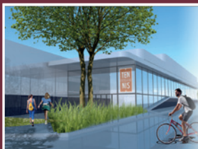
Le projet de rénovation du Tennis Club Boulonnais est lancé