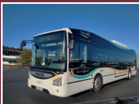
L'agglo investit dans de nouveaux bus hybrides