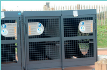
Aire de covoiturage et les consignes à vélo à Marquise