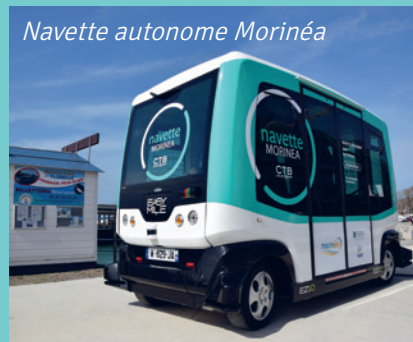
Navette autonome Morinée

Plus d'informations sur la mobilité de la CAB : http://www.agglo-boulonnais.fr/quotidien/mobilite/