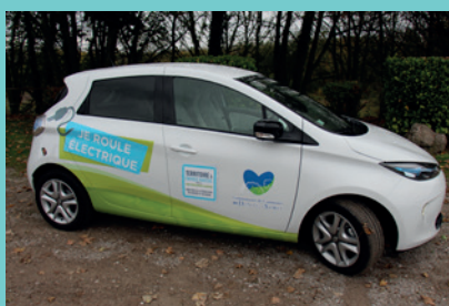
Véhicule électrique de service de la Communauté de Communes de Desvres Samer

La transition écologique passe par une remise en question de nos politiques en matière de mobilité. Il nous faut tenir compte aussi de nouvelles pratiques, de nouveaux comportements : co-voiturage, voitures électrique, optimisation des transports en commun... Il s'agit de ne négliger aucune piste.